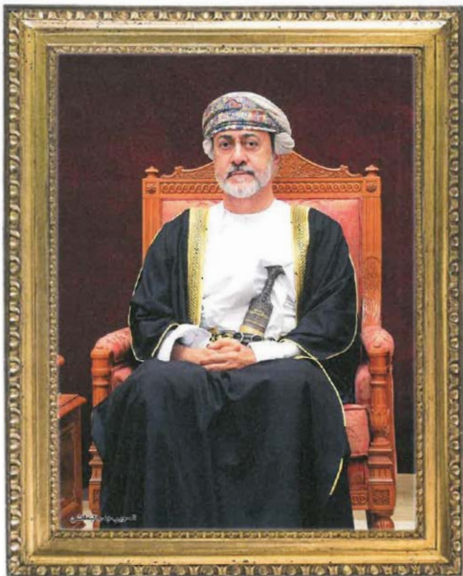
حضرة صاحب الجلالة السلطان هيثم بن طارق المعظم - حفظه الله ورعاه -