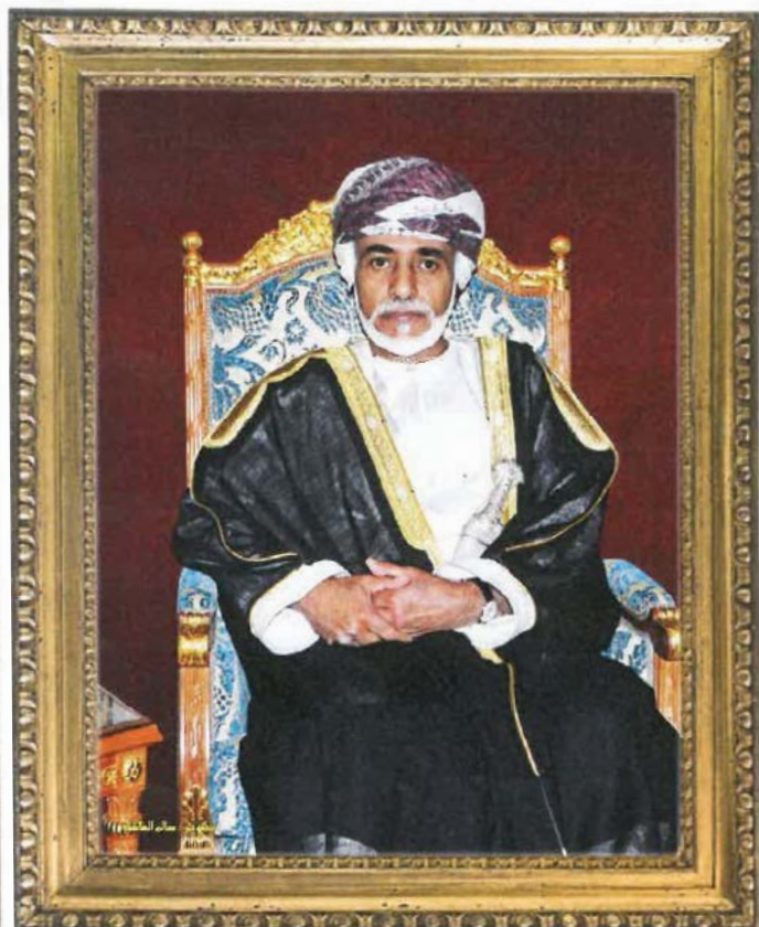
حضرة صاحب الجلالة السلطان قابوس بن سعيد بن تيمور - طيب الله ثراه -